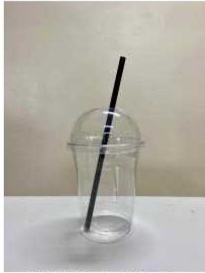
플라스틱 음료수 병과 빨대