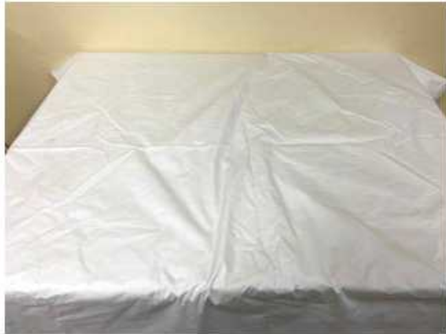
흰색 천 (흰색 천 위에 정물을 올리고 그리시오)

정물 수채화 : 제시된 정물 사진들을 보고 자유롭게 구도를 잡아 수채화로 표현 (제시된 정물들은 반드시 넣고 중복으로 그려도 됨)