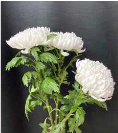
하얀 국화꽃 3개